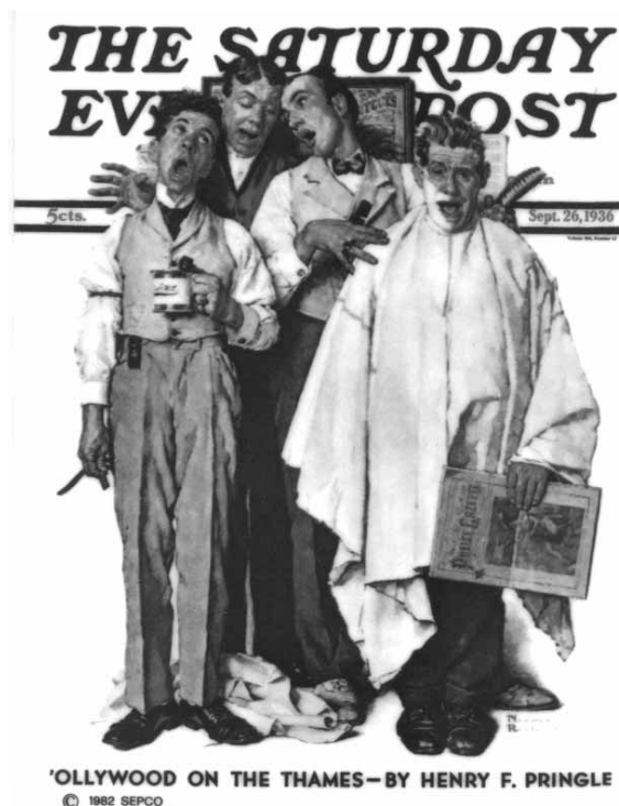
De tekening van Norman Rockwell op het omslag van de Saturday Evening Post in september 1936 verbeeldde treffend de heersende nostalgie. Vier zingende blanke mannen bij de kapper. Je kunt de paard-en-wagens bijna horen ratelen over de keien voor de deur.