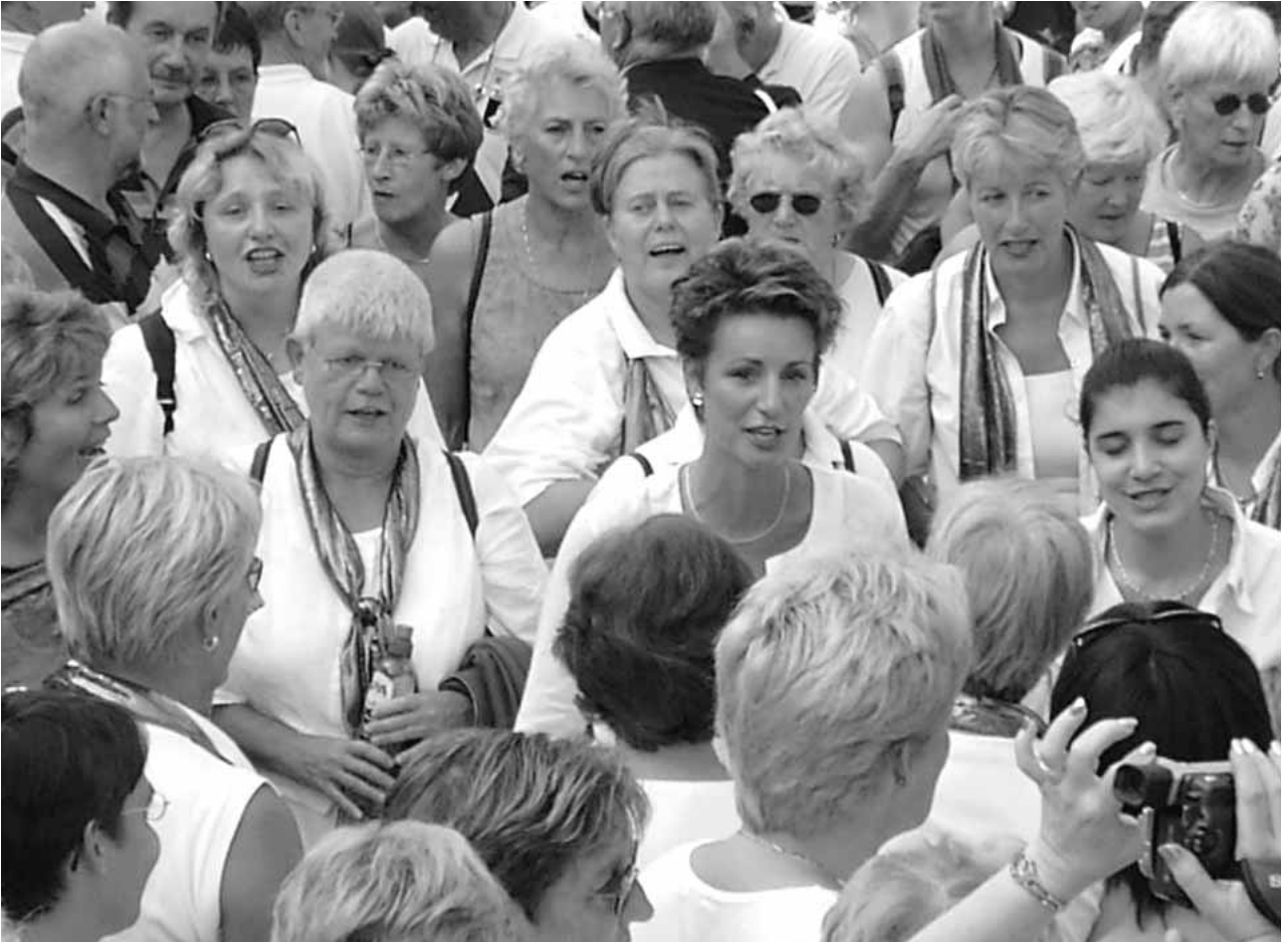
The Swinging Woodnotes