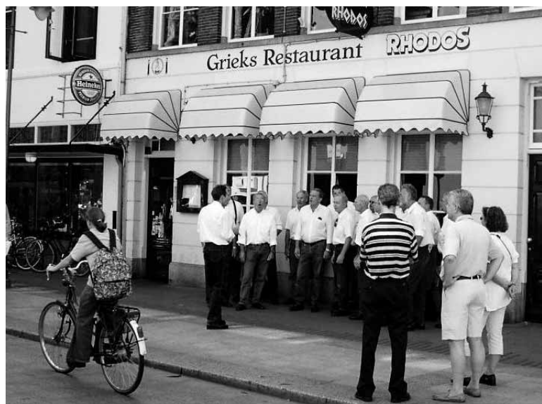
Ring River Singers