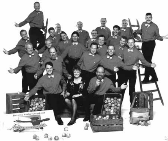
Fruit Unlimited in betere tijden

Toen ook nog enkele leden opzegden, omdat zij de basis voor een koor te smal vonden, werd de stemmenverhouding zo onevenwichtig dat het bestuur besloot een extra ledenvergadering bijeen te roepen op 27 oktober. Daarin viel het besluit om uit de DABS te treden. Opmerkelijk is dat het koor enkele jaren geleden bij het eerste lustrum nog dertig leden haalde. Tijdens de korencompetitie van november 2002 eindigde Fruit Unlimited op de laatste plaats.