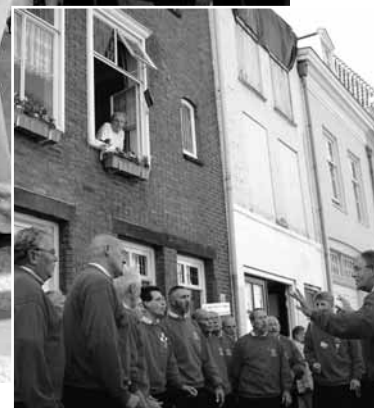
Sir Hugo's Worthy Singers