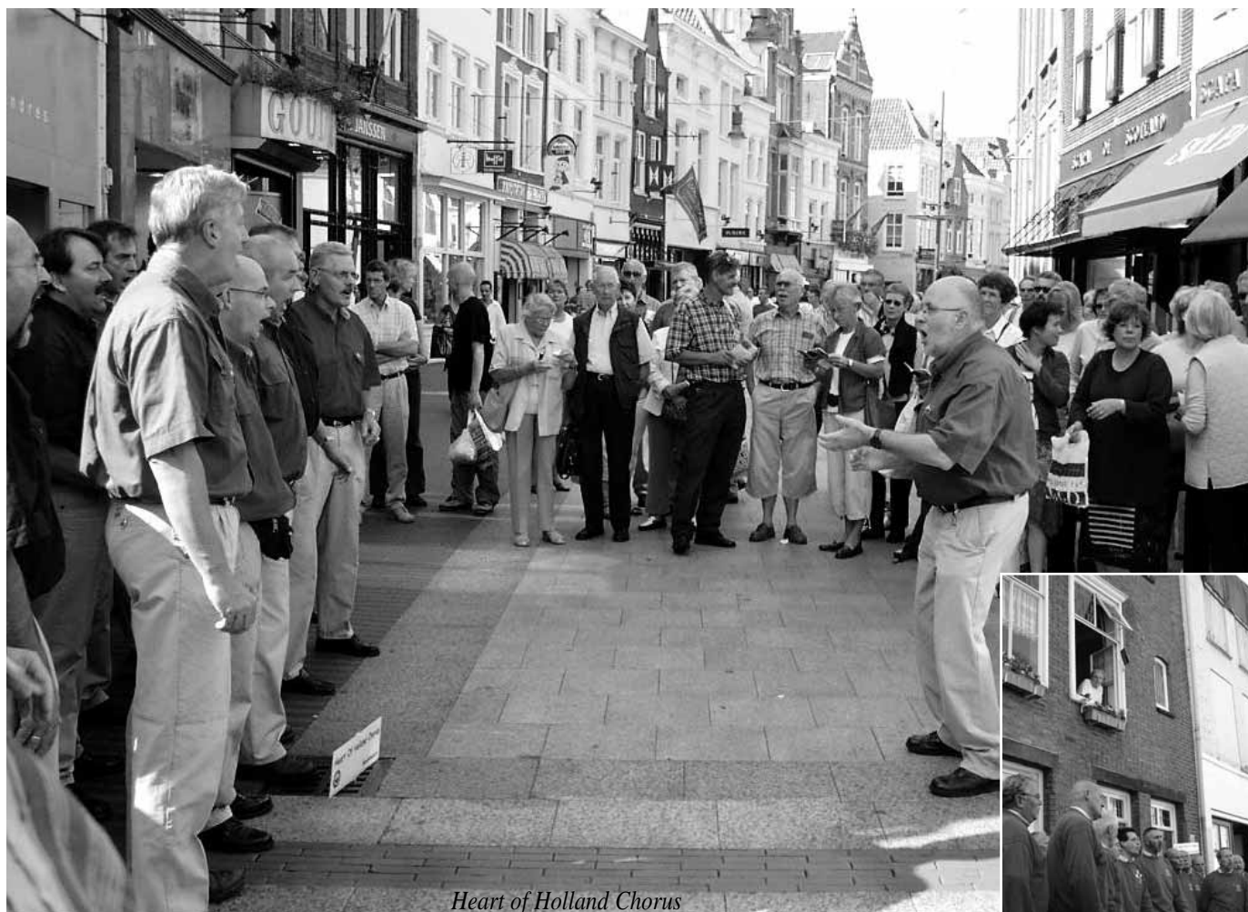
Heart of Holland Chorus